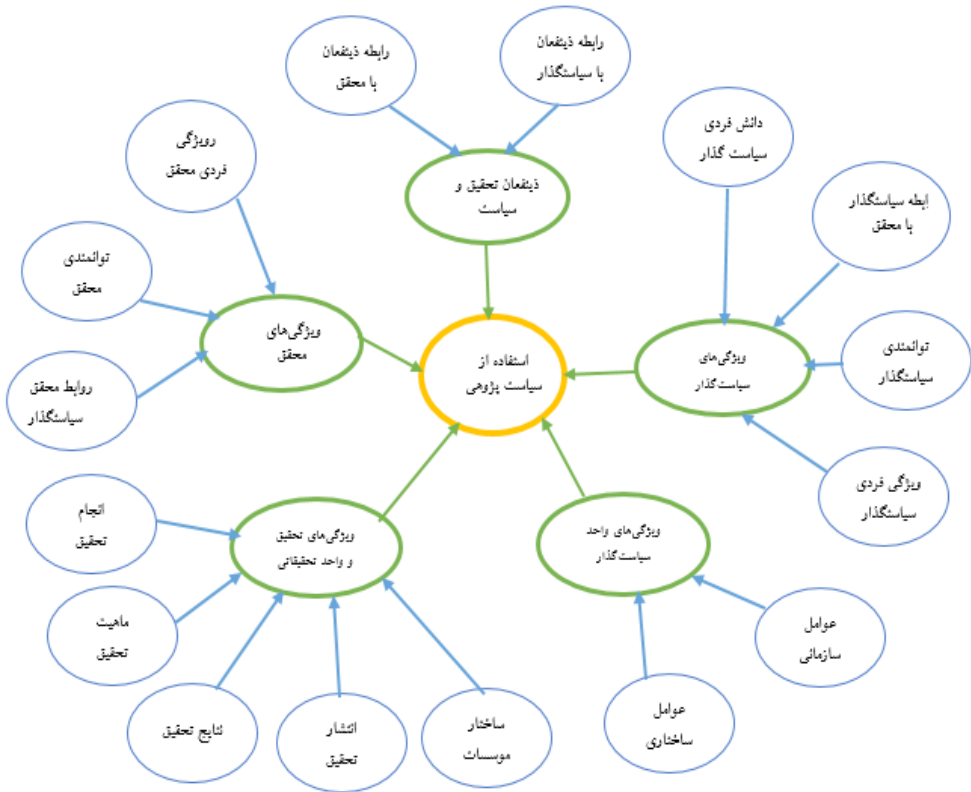
تصویر ۱. مدل استفاده از سیاست پژوهی در دو سطح بُعد و مقوله