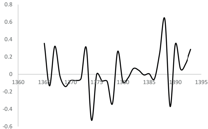
شکل ۲. نمودار رشد نسبت فقر سرشمار کل کشور (میانگین وزنی شهری و روستایی)