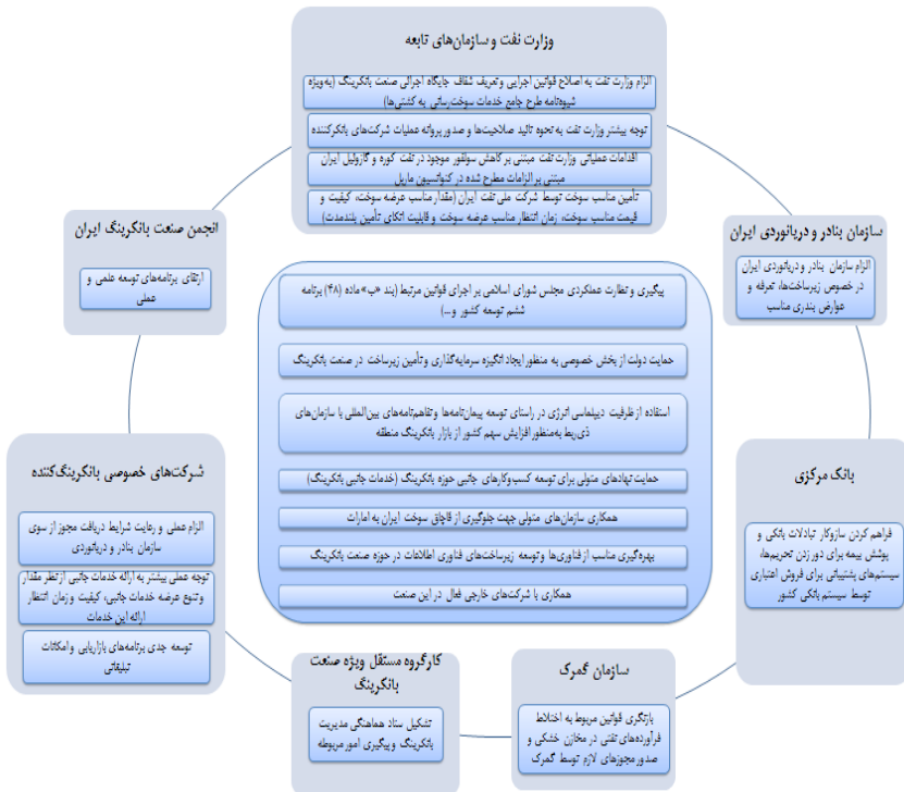
تصویر ۲. مدل توسعه صنعت بانکرینگ ایران (راهکارهای پیشنهادی متناظر با هر کنشگر)

در این پژوهش، با به کارگیری پارادایم تفسیر‌گرایی، الگویی برای توسعه صنعت بانکرینگ کشور با تأکید بر کنشگران ارائه شد. تصویر شماره ۱ نشان‌دهنده ایفای نقش کنشگران تأثیرگذار در چهار گام اصلی توسعه صنعت بانکرینگ ایران یعنی سرمایه‌گذاری، ارائه تسهیلات حمایتی، عملیات مناسب بانکرینگ و خدمات جانبی و همچنین اقدامات نظارتی و کنترلی شایسته است. ضمن اینکه این موضوع در پژوهشی (ناظمی و همکاران، ۱۳۹۶: ۱۲۵) نیز مورد تأکید