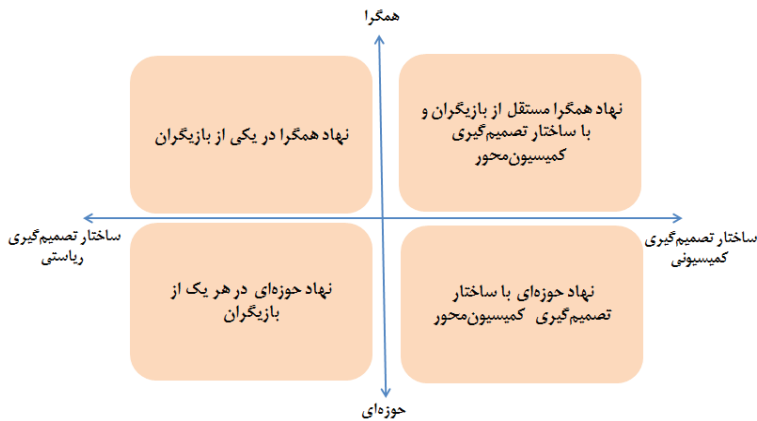
شکل ۱. چهار الگو برای نهاد تنظیم گر

همان گونه که در بخش الگوهای نهاد تنظیم گر ذکر شد، در خصوص نهاد اصلی تنظیم گر، سه بُعد ساختار تصمیم گیری، محدوده کاری، و تفکیک خط مشی گذاری و مقررات گذاری قابل بررسی است. در دو بعد نخست، چهار الگو شناسایی شده است که در نمودار ۱ آمده است. شایان ذکر است مشارکت عموم در امر تنظیم گری نیز رویکردی است که در تجربیات اغلب کشورها دیده می شود.