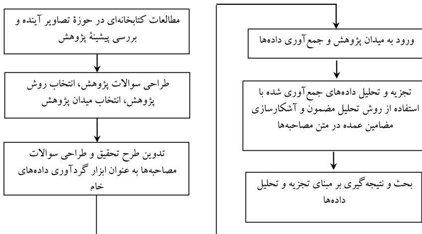
شکل ۱. نمودار فرایند انجام پژوهش

پژوهش حاضر از منظر هدف، بنیادی - تجربی است و در سنت پژوهش‌های کیفی انجام شده است. فرایند انجام تحقیق در نمودار شکل ۱ زیر نشان داده شده است.