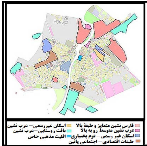
تصویر ۳. پراکنش قشربندی اجتماعی شهر به همراه جدایی‌گزینی قومیتی کلانشهر اهواز (شرکت مشاور عرصه، ۱۳۹۱)

این پژوهش، زمانی موتور حرکت هوشمندسازی کلانشهر اهواز منظم و با قدرت به حرکت درمی‌آید که مردم به‌عنوان مهم‌ترین رکن شهرهای هوشمند نسل سوم، دارای درک مفاهیم و رویکردهای جهانی، متمایل به یادگیری، مشارکت‌کننده در زندگی اجتماعی، علاقه‌مند به شهر، دارای انسجام اجتماعی و خلاق باشند.