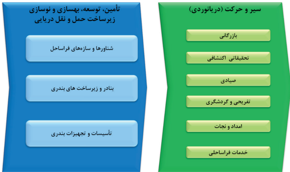
شکل ۲- زنجیره ارزش حمل و نقل دریایی

توقف طولانی مدت شناورها هستند. تأسیسات بندری شامل کانال‌های دسترسی، تجهیزات محافظت بندر مانند موج‌شکن‌ها، و علائم کمک ناوبری و چراغ‌های دریایی است که به دریانوردان در تعیین موقعیت و مسیر دریانوردی کمک می‌کنند. دریانوردی به انواع بازرگانی، اکتشافی، صیادی، تفریحی و گردشگری، امداد و نجات و خدمات فراساحلی تقسیم می‌شود که هر کدام نقش خاصی در بهره‌برداری از منابع و امکانات دریایی دارند. دریانوردی بازرگانی شامل کشتیرانی ترمپ و لاینر است که با برنامه‌های تردد مختلف انجام می‌شود. دریانوردی اکتشافی به مطالعه و اکتشاف ذخایر معدنی و مسائل علمی می‌پردازد. دریانوردی صیادی به پرورش و صید آبزیان اختصاص دارد. دریانوردی تفریحی و گردشگری شامل فعالیت‌های تفریحی آبی و تورهای کروز است. دریانوردی امداد